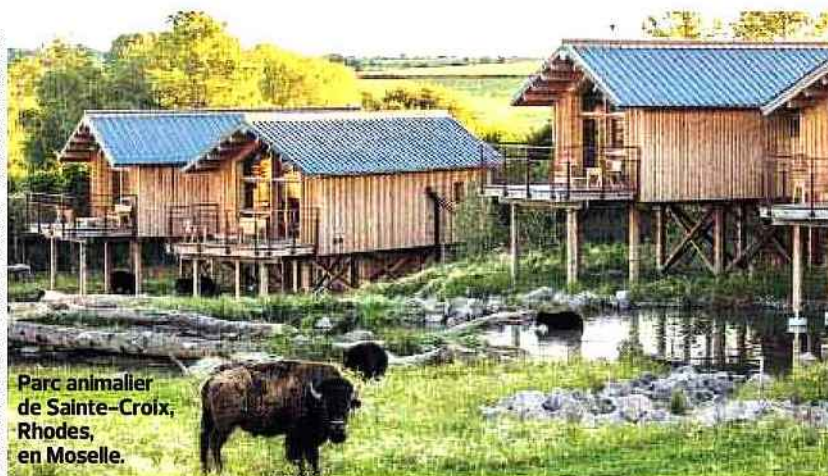
Parc animalier de Sainte-Croix, Rhodes, en Moselle.