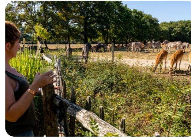
Safari Tente - Bivouac en Tanzanie