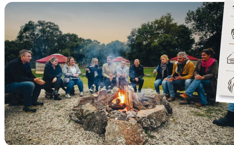
Yourte - Bivouac en Mongolie

https://www.planetesauvage.com/dormir-au-zoo/les-bivouacs À partir de 129 €/personne